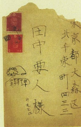
疎開地からの手紙（封筒） （昭和20年1月14日）