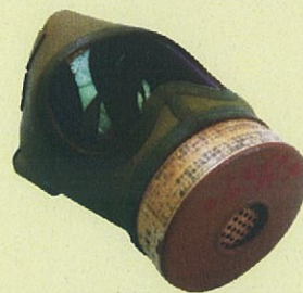
十七年式防空用防毒面 個人蔵