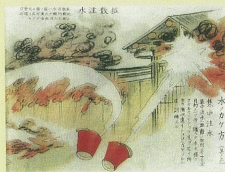
『隣組防空絵解』（大日本防空協会、昭和19年）