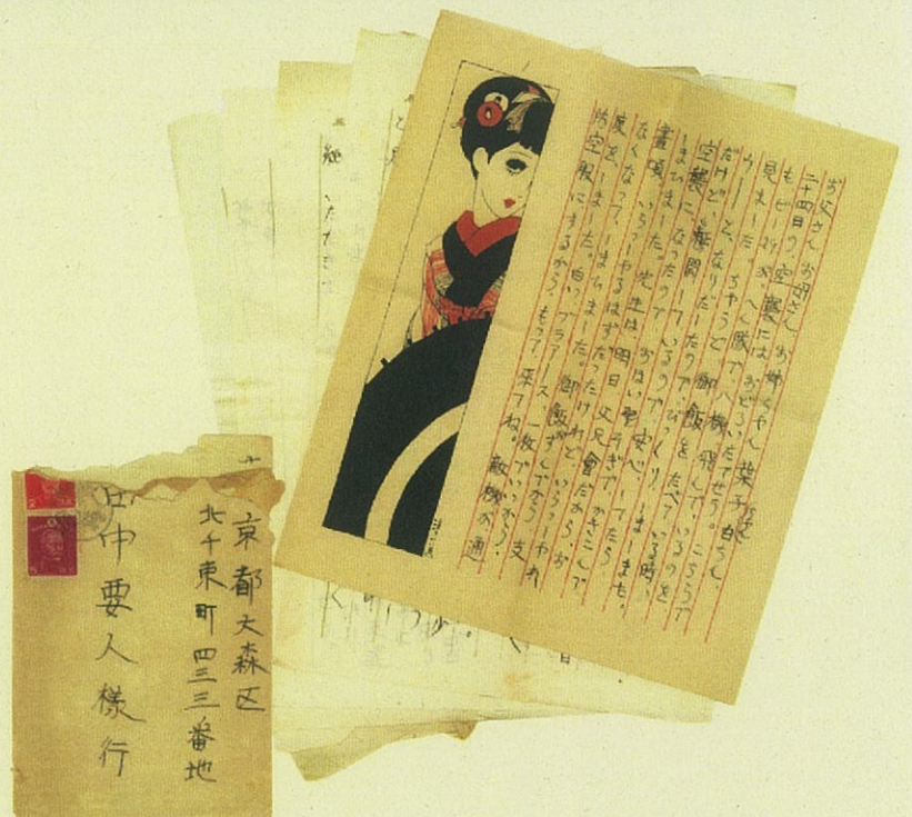
疎開地からの手紙（昭和19年11月25日）

また、疎開が行われるようになった背景、東京都の疎開に関する文書、防空政策などについても合わせて展示し、戦争について考える機会にします。